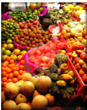
Früchte auf einem indischer Markt